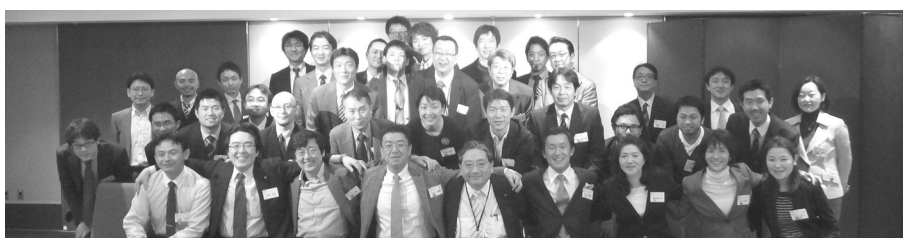
▲第2回若手経営者の会(13年2月・東京のホテル・メトロポリタン・エドモントにて)

新規事業への模索や事業継承など、後継者としての様々な悩みを話す機会を求めていたということを感じました。そこで、以前は各地域で行われていた会合を組織的に行き、同じ月に重複開催しないなどの効率化を図り、全国の若手病院経営者をもっと多く、かつ気楽に意見交換できる場を提供しようと、現在、当委員会で調整に努めているところです。