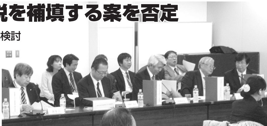
▲診療側は別建ての基金で高額投資の消費税を補填する方法に反対した。

一貫として医療への消費税原則課税を求めている四病協は、8%への引き上げを1年後に控え、消費税法改正法や3党協議合意文書で提起されている別建てによる補填方式への対応を2月27日の総合部会で協議した。その結果、10%引き上げ時には課税とすることを求める立場から、「別建て方式の導入