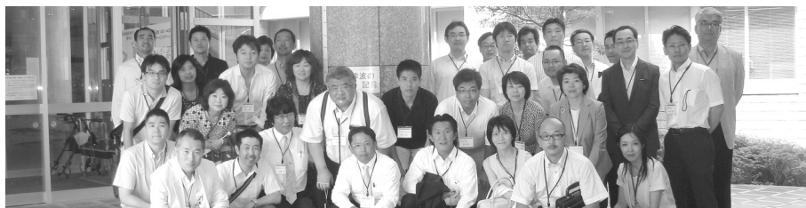
▲第1回東日本若手経営者の会(12年7月・女川町地域医療センターにて)