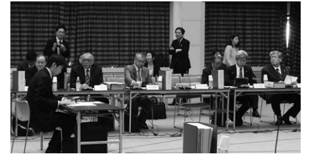
中医協総会。

また、同日承認した新医薬品のうち、ミカトリオ配合錠(日本ベーリンガーインゲルハイム)とミケルナ配合点眼液(大塚製薬)を、処方日数制限の例外とすることを了承した。処方日数制限の取扱いでは、薬価収載から1年間は原則1日14日分を限度に投与するルールがあるが、既収載品の配合剤などの場合は制限を設けないとの取扱いと