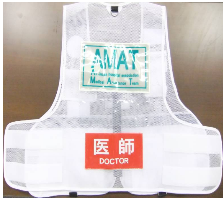
AMATベスト(医師用・裏)