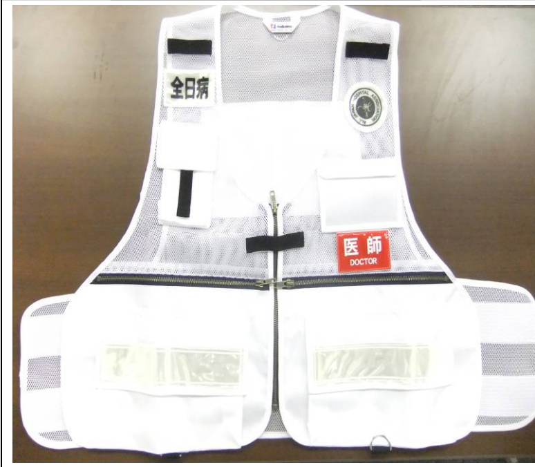
AMATベスト(医師用・表)