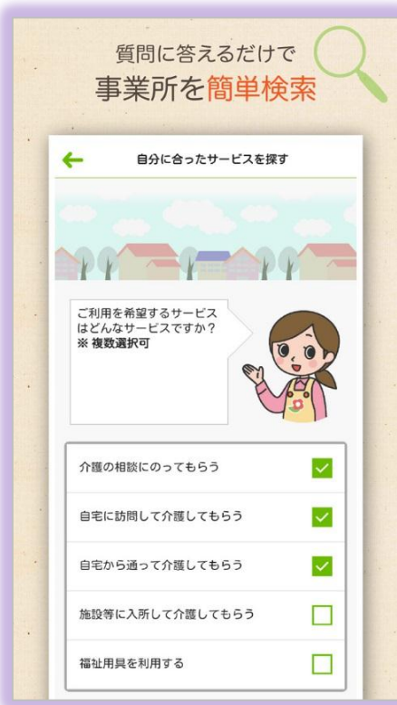
介護サービスに詳しくない方には質問形式で誘導