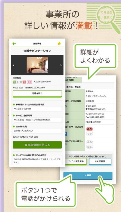
事業所の基本的な情報がコンパクトにまとまっている