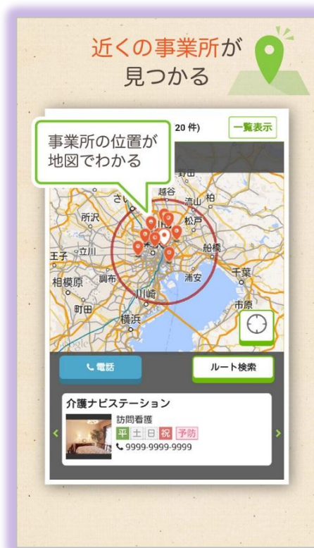
現在地からの距離や道順が分かる