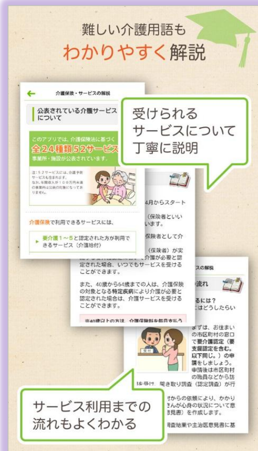
介護保険制度やサービスの利用手順等がイラストで解説