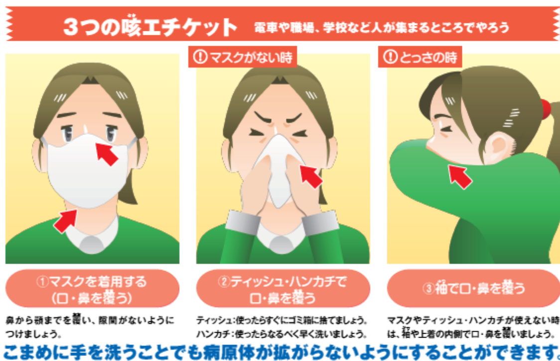
図3 咳エチケットについて