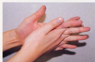
4. 指の間を十分に洗う