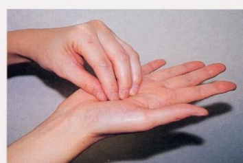
3. 指先、爪の間をよく洗う