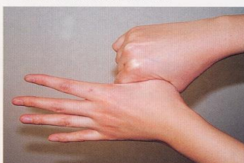
5. 親指と手掌をねじり洗いする