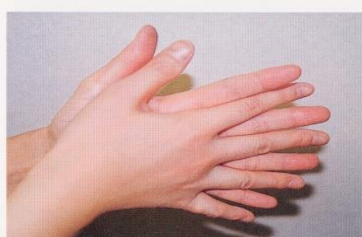
1. 手のひらを合わせ、よく洗う