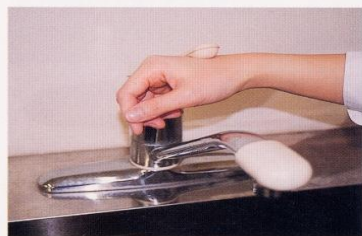
7. 水道の栓を止めるときは、手首か肘で止める。できないときは、ペーパータオルを使用して止める