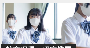
教育現場・研究機関

お客様訪問がある接客クルーやどうしても出社せざるを得ない職場でも、安心して働けることを目指します。