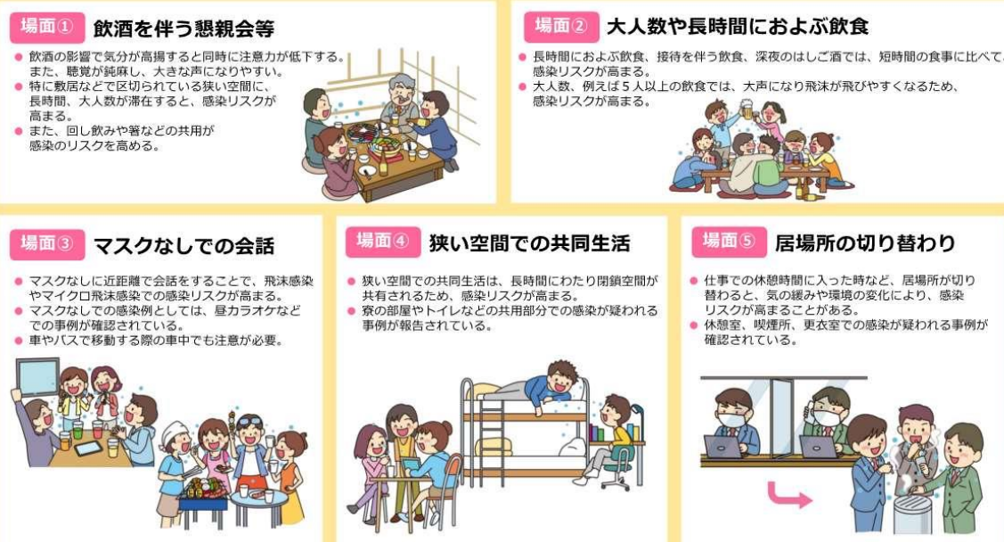
図2 感染リスクが高まる「5つの場面」（内閣官房のウェブサイトより一部抜粋）