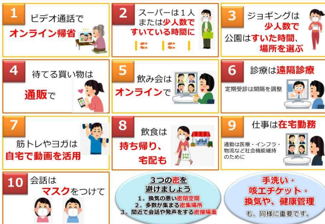
図1 人との接触を8割減らす、10のポイント（厚生労働省のウェブサイトより一部抜粋）

緊急事態宣言の中、誰もが感染するリスク、誰でも感染させるリスクがあります。 新型コロナウイルス感染症から、あなたと身近な人の命を守るよう、日常生活を見直してみましょう。