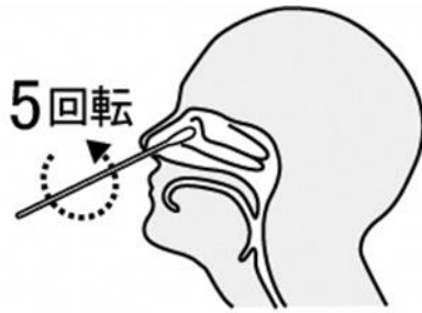
鼻腔ぬぐい液採取