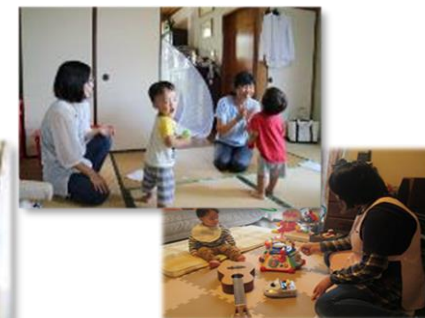
育児支援のイメージ