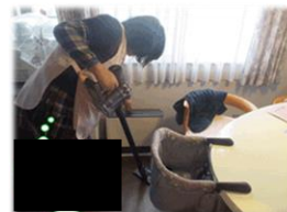
家事支援のイメージ