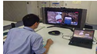
技術者が、カメラ映像を確認し、現場へ指示