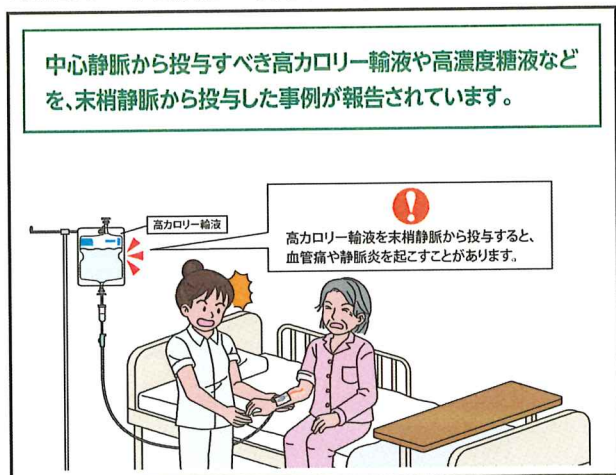
No.209 中心静脈から投与すべき輸液の末梢静脈からの投与