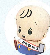
国勢調査 イメージキャラクター