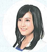
国勢調査 プロジェクトチーム 国勢調査員代表