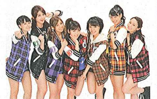
公式応援団 アップアップガールズ(仮)