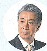
国勢調査 プロジェクトチーム リーダー