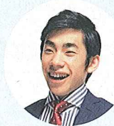
国勢調査 プロジェクトチーム 広報担当