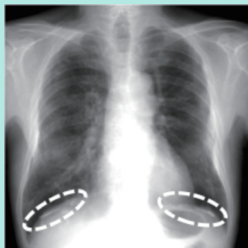
例1) 典型的石灰化胸膜プラーク