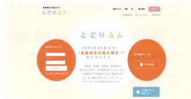
「とどけるん」のトップページ